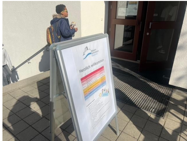
Für Kinderbetreuung war gesorgt, daneben und darunter Bilder nach dem Schnupperunterricht, Töpfern wurde angeboten, Ausstellungen u.v.m. Auch das Café war gut besucht... und viele Schilder halfen bei der Orientierung.