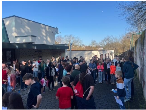
Links undere Fragetische und rechts sehen Sie Eltern und Kinder bei Schulführung oder auf dem Weg zum Schnupperunterricht. Unten dann weitere Impressionen vom heutigen Tag: